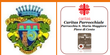
CARITAS PIEVE DI CENTO