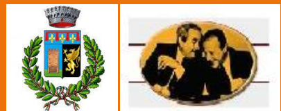
CENTRO FALCONE e BORSELLINO SAN GIORGIO DI PIANO